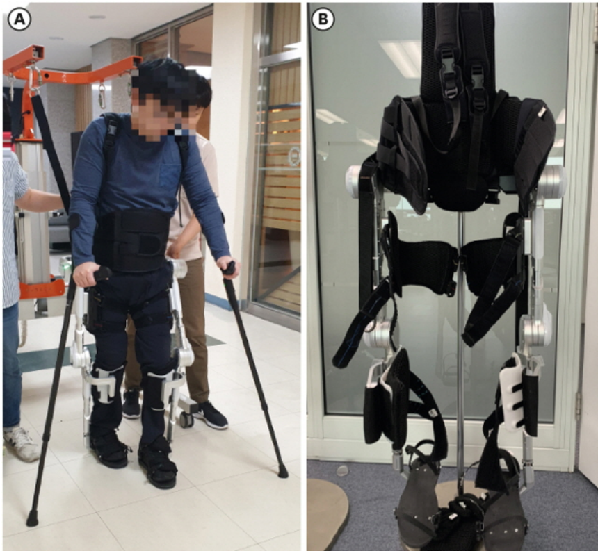
현대자동차의 웨어러블 로봇 H-MEX가 SCI 저널을 통해 유용성을 입증했다

8일 의료산업계에 따르면 현대자동차 그룹이 10년전부터 출발한 웨어러블 재활 의료 로봇인 H-MEX가 대표적인 의료 로봇의 상용화 모델로 꼽힌다.