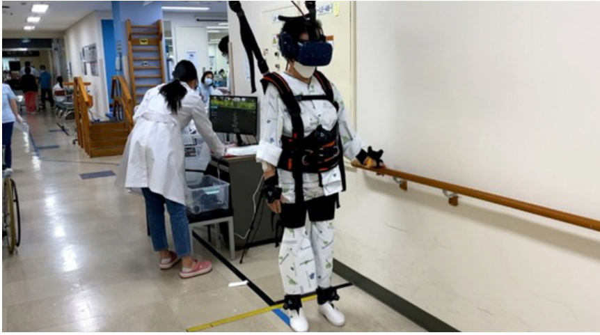
가상 현실을 접목하는 등의 새로운 시도들이 진행되고 있다.

가상 현실을 통해 뇌졸중, 치매 등으로 보행 능력을 상실한 환자에게 보행과 균형, 인지 과제 수행 등의 재활 치료를 동시에 진행할 수 있도록 설계된 기기.